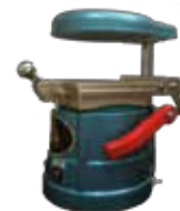
Máquina Yu Yin Yu Yin vacuum former machine

Más económica para planchas más finas (MC)