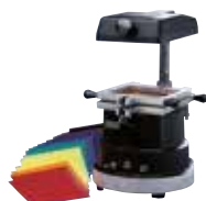
The Machine The Machine

Máquina de adaptaciones termoplásticas, CE Vacuum former machine, CE 2 años de garantía (M)